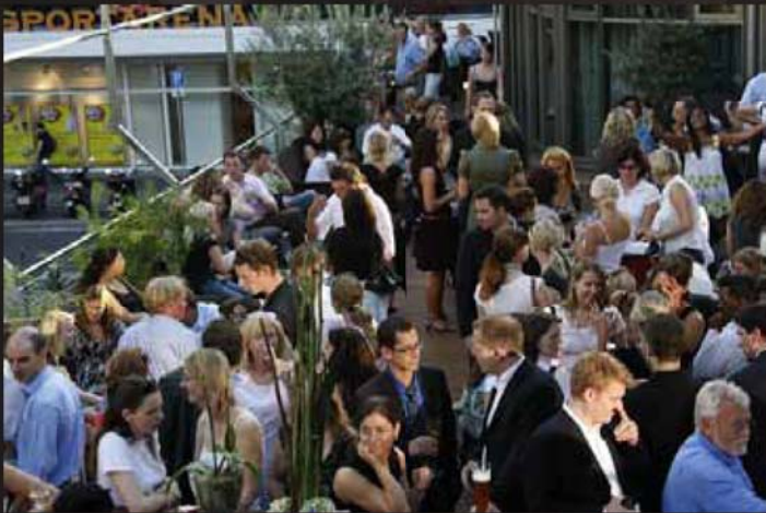
Terasse Ansicht 2