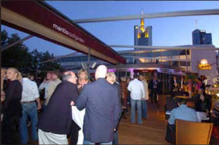
Terasse Ansicht 1

Kontaktieren Sie uns per Mail für mehr Fotos!